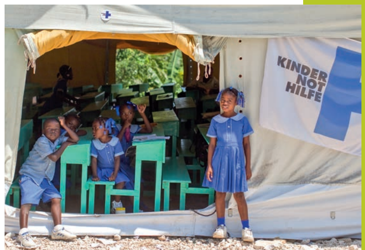
Notschulprogramm: Unter Zeltplanen oder Bäumen konnten die Kinder bald wieder lernen.