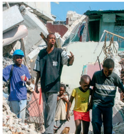
In den Trümmern der zerstörten Schulen wurde tagelang nach Verschütteten gesucht.