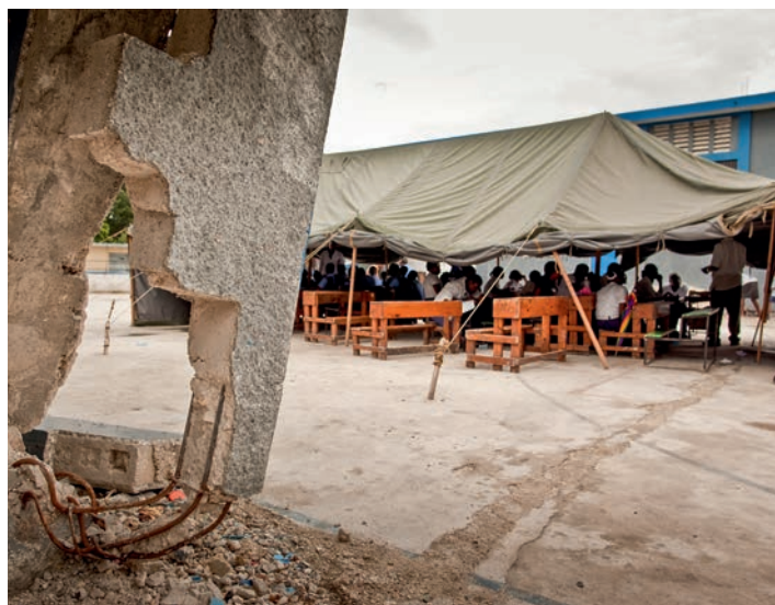
Auf dem zerstörten Areal des Collège Véréna öffnete kurz nach dem Erdbeben eine Notschule.

Eine Bilanz von Jürgen Schübelin, Lateinamerika-Referatsleiter der Kindernothilfe