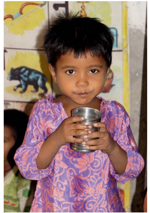
Im Kindernothilfe-Förderzentrum bekommen die Kinder sauberes Wasser und Essen, hier lernen sie lesen, schreiben und rechnen. In liebevoller Umgebung können sie wieder Kind sein.