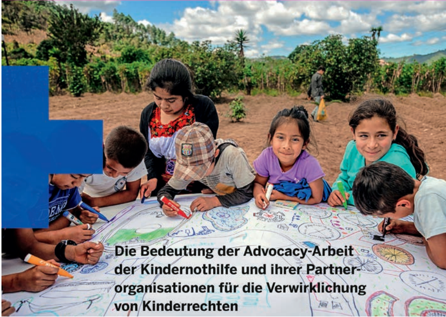
Die Bedeutung der Advocacy-Arbeit der Kindernothilfe und ihrer Partnerorganisationen für die Verwirklichung von Kinderrechten