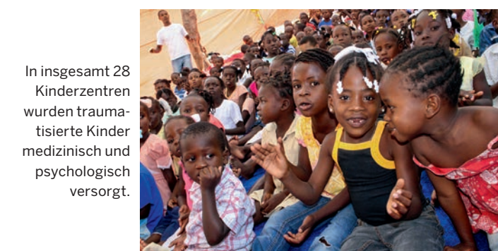
In insgesamt 28 Kinderzentren wurden traumatisierte Kinder medizinisch und psychologisch versorgt.