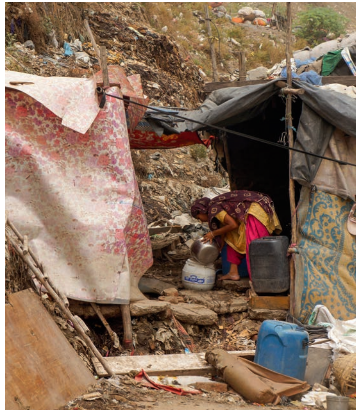
Wohnen am Fuße der Müllhalde: Inmitten des Drecks wird geschlafen, gekocht und gespielt.