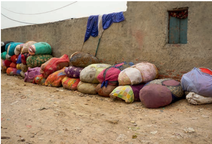
Haare, Plastik, Stoff- oder Aluminiumreste – der Müll wird in Säcke sortiert und zu Geld gemacht.

Krankheiten oder HIV-positiv. Viele schnüffeln Klebstoffe, um der brutalen Realität zumindest für kurze Zeit zu entfliehen. Viele werden Opfer von Gewaltverbrechen, die niemals jemand melden, geschweige denn aufklären wird. An einen Schulbesuch ist meist nicht zu denken, zu hart ist der tägliche Kampf ums Überleben.