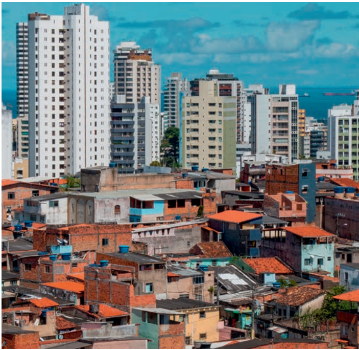
Arm und Reich, Tourismus und Favela liegen in Fortaleza dicht beieinander.

Jugendlichen hat Gewalt schon am eigenen Leib erfahren. Nicht nur zu Hause, in der Schule oder durch Drogenbanden, sondern auch durch Polizei und Militär. Um den Eindruck zu erwecken, die Situation im Griff zu haben, greift die Polizei oft mit voller Härte durch. Doch Gewalt generiert noch mehr Gewalt. Jugendliche, die selbst Opfer von Gewalt wurden, sind oft nicht lange danach selbst die Täter. Hier setzt die Kindernothilfe-Partnerorganisation Terre des Hommes Brazil an: mit ihrer Strategie der Mediation und gewaltfreien Konfliktlösung. Tausende Kinder und Jugendliche werden zum Thema Kinderrechte geschult und üben, Auseinandersetzungen friedlich zu lösen.